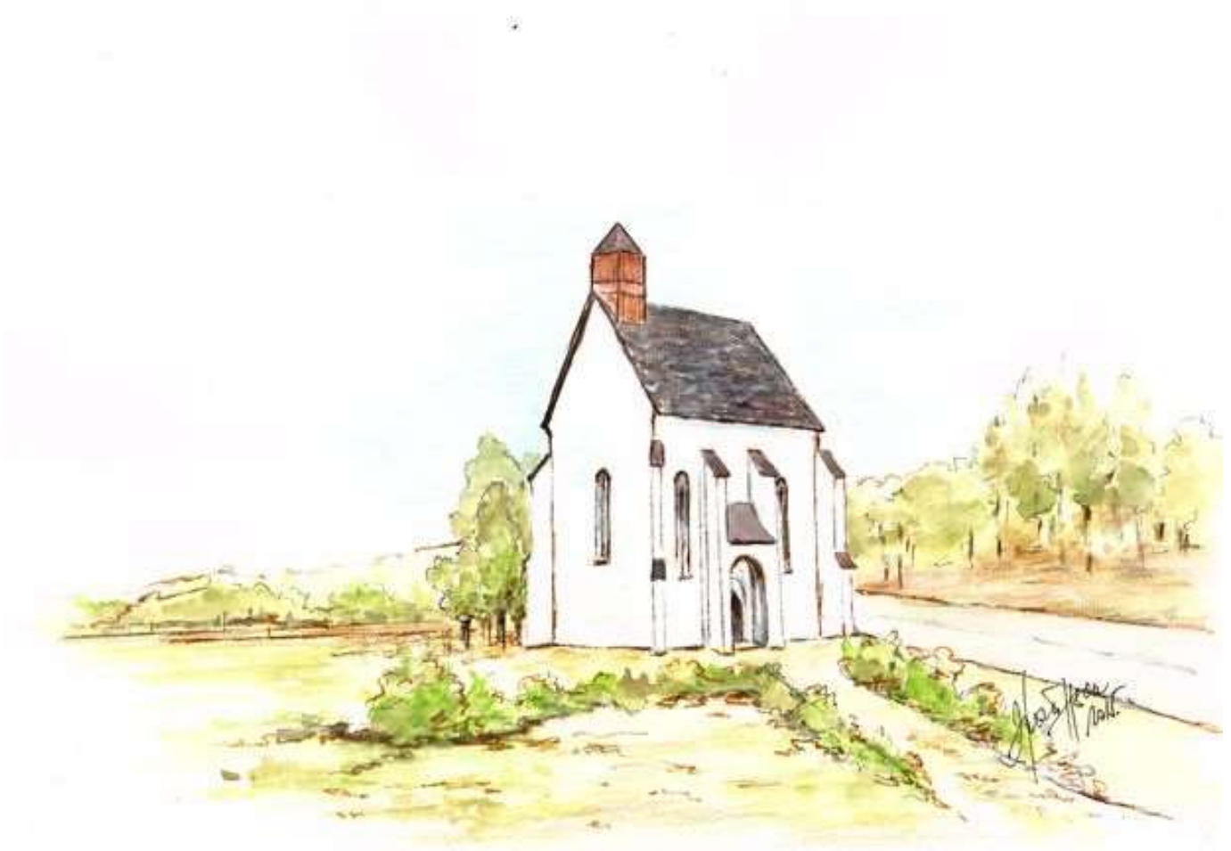
Bonyha 1510 körül épült gótikus temploma