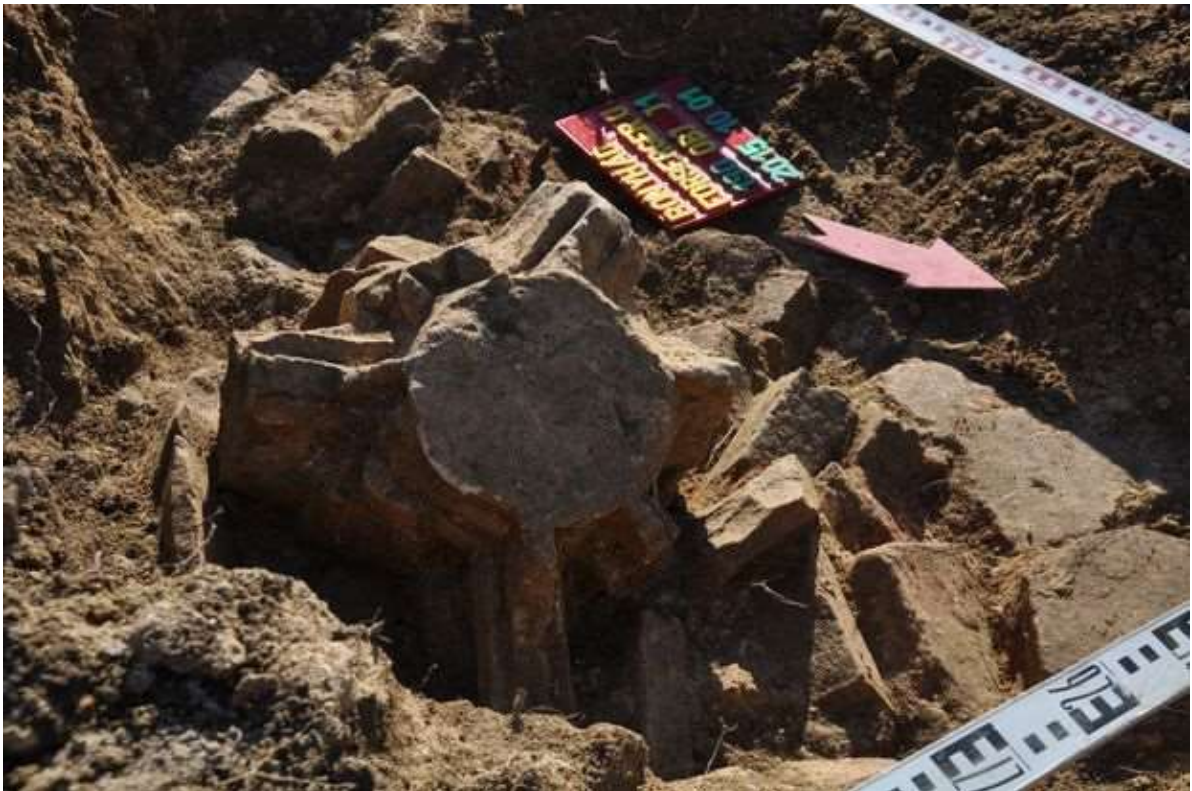
A szentély késő gótikus hálóboltozatának záróköve